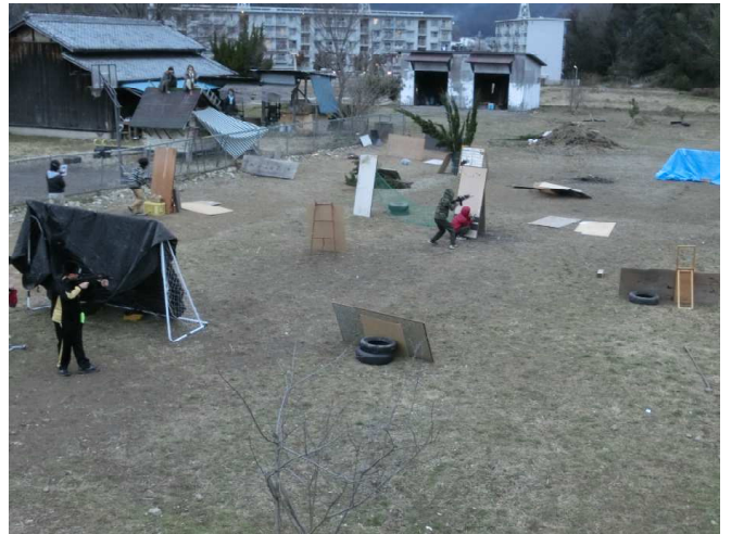
サバイバルゲーム！

何か提案したいイベントがある時はまず、提案ボードにやりたい事と提案者の名前を書いてもらい、子どもミーティングで参加希望者が集まり一から決めていこうというものです。もちろん今まで通り、