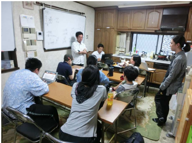
ミーティングの様子

主な議題は、移動手段、引率スタッフ、観光スポット、旅費の計上 etc ……不安も問題も山積みで、決まった事柄の問題点が次の会議で指摘され、再度話し合うこともザラでした。