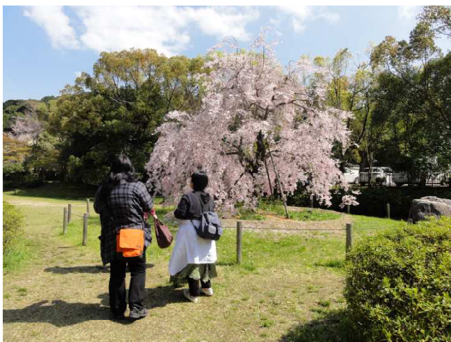
京都お花見の様子

他にもミーティングを通して決まったイベントには「大阪城へお花見へ」や「ボウリングへ行こう」、「フォロとバスケ&テニス」「ギョーザを作ろう！」などがあり、これからも楽しいみなもイベントが色々増えていきそうです！