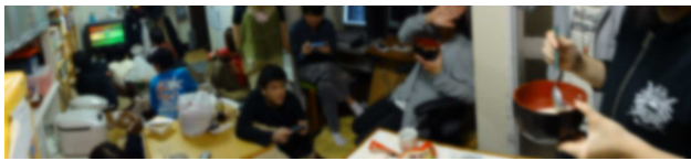
↑お泊り会中の1階の様子です

夜になって、みんなが寝たりしださないのに驚いたのは当たり前、夜中に、シフォンケーキを食べたことと、それから40分ほど経って3分間の軽い睡眠をとったら、それまでの40分間の記憶がすっかり飛んでしまったことまで覚えています。確か眠りについたのは4時40分くらいでしたでしょうか。目覚めたのは7時前でした。