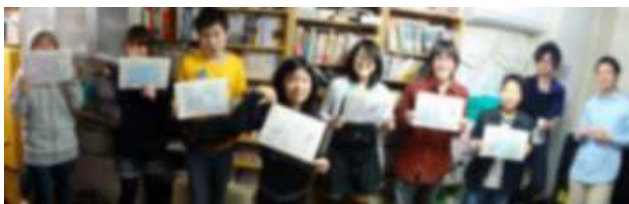
一人一人への手作り卒業証書と卒業卒業生全員での写真。

さて、去る 2012 年 3 月、みなもからは 5 人の卒業者が出ました。活動を始めて 7 年とちょっと。少しずつみなもを旅立ち、次の道を進みはじめた人達が増えてきました。もちろん、みなもにはいろんな子ども達が来て、いろんな旅立ち方があります。年度途中でみなもとして一定の役割を終え、フェードアウトしていく子どもも多い中、3 月末で明確に「卒業」として旅立つ子どもはほんの一握りですが、今回はそのほんの一握りの「卒業者」のメッセージと、卒業その後に触れてみたいと思います。