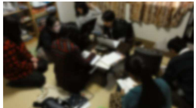
↑なにやら制作中の様子？

みなもで学んだことは今でも本当に貴重な体験で、落ち込んだときや、人付き合いに関しては特に重宝しています。また大阪に戻ったら顔出しますね。