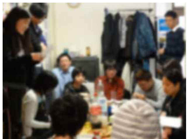
↑答辞を読んでいるところ。しんみりしています。

どれだけ時間が経ち、みなものメンバーが変わっても。形や名前が変わっても。心の傷ついた人たちを、みんなが優しく迎えてくれる。ここが、そんなあたたかな場所であり続けますように。いつか、大人になった私が、久しぶりにひょっこりと顔を出したその先に、このあたたかな『みなも』がありますように。