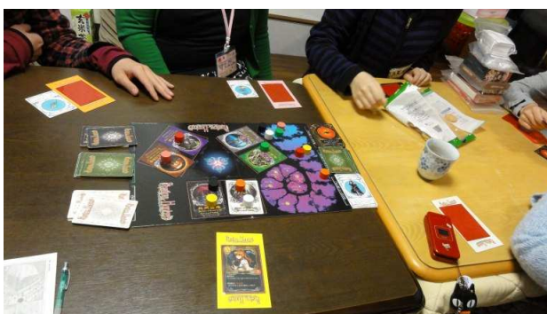
↑みなもで一番人気のある？『シャドウハンター』

基本的に、お泊り会では睡眠時間の短い私ですが、このときも3時間は眠れなかったんですね。やけに40分との縁がありますが気にしないで頂きたいところです。と、こうして初めてのお泊り会を振り返ってみるといつも思うのですが、いつも自分の話したことや他人の話したことは耳がちくわになったかのごとく頭から抜けていくというのに、こういう妙なことだけはちゃんと頭の中に残しておいてくれるんですね。